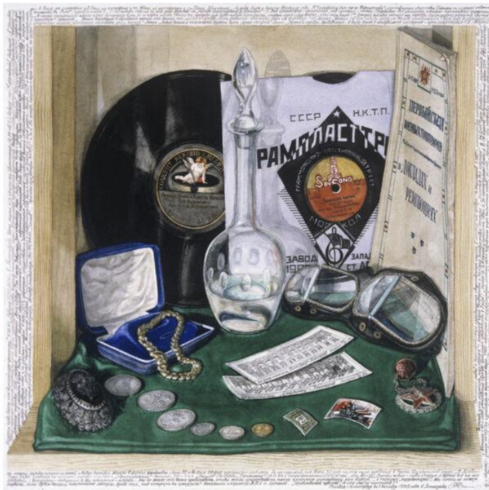
Репродукция картины художника Рэма Венецкого «Атмосфера моего детства»

Новые пластинки много раз записывали, они меняли владельцев и постепенно теряли в качестве. Тогда её «сбрасывали лохам» — винил мыли, полировали до блеска одеколоном или воском, чтобы спрятать царапины. Опытный покупатель нюхал винил — если от него шёл запах парфюмерии, то диск был старым. Бывало, что мазали диски гуталином, польским антистатиком для пластика или «смесью №3» — коктейлем из гуталина, касторки и спирта. Выглядела такая пластинка прекрасно, но под иглой проигрывателя начинала издавать страшные скрипы, шорохи и визги.