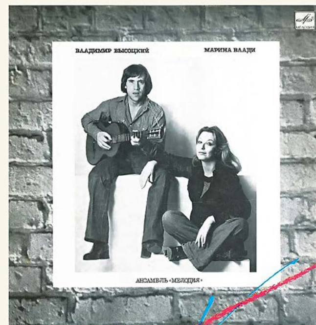
Конверт виниловой пластинки «Владимир Высоцкий и Марина Влади», выпуск 1987 г.

жется, что перед нами разыгрывается спектакль одного актера: большую часть пространства записи занимает Тот Самый Голос, а ансамбль «Мелодия» лишь аккуратно расставляет для него минимальные