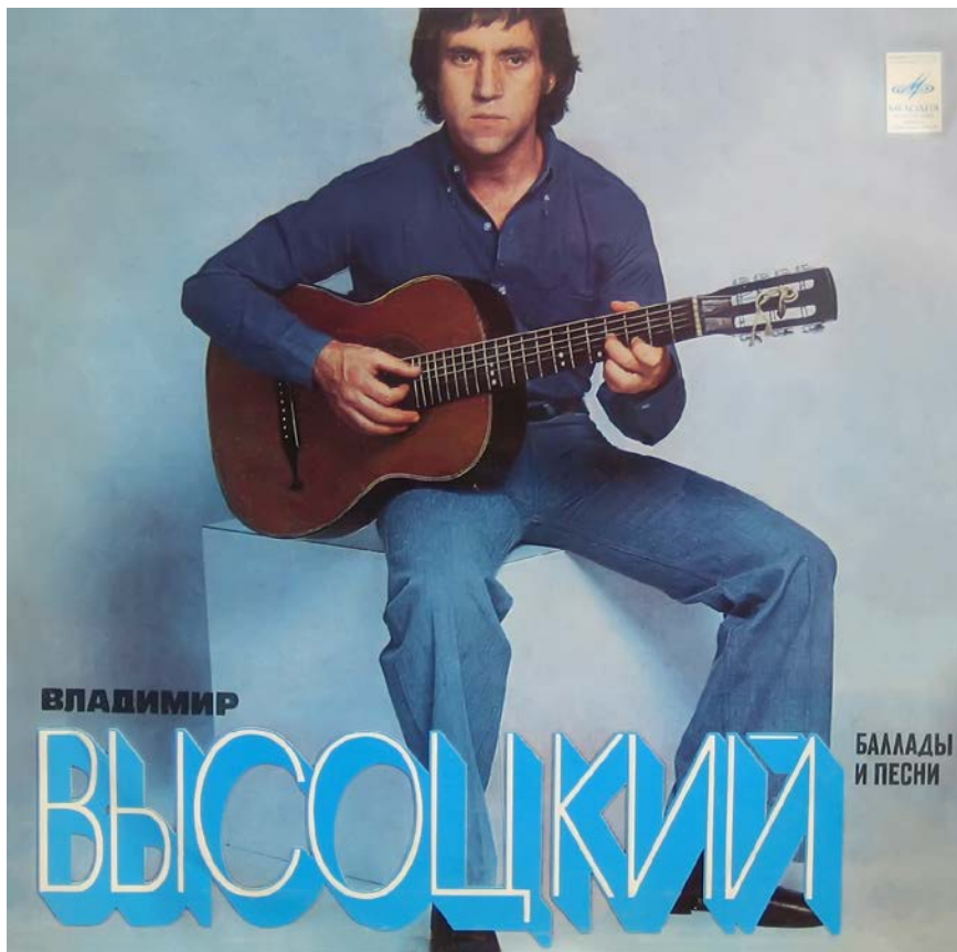
Конверт виниловой пластинки «Владимир Высоцкий. Баллады и песни», выпуск 1978 г.