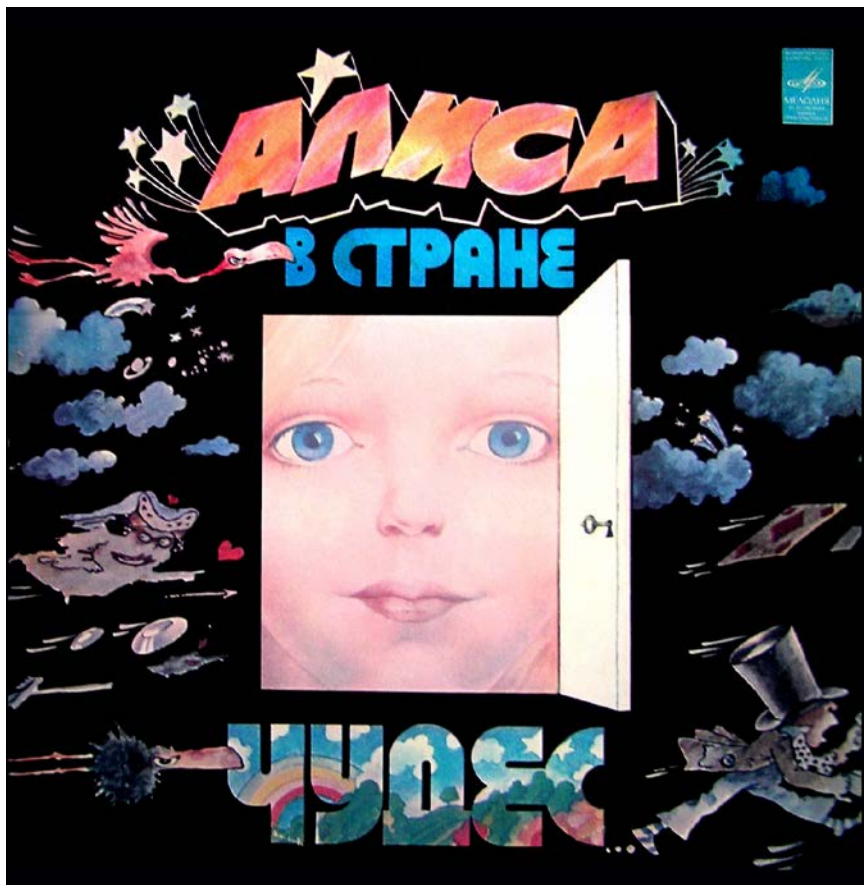
Конверт виниловой пластинки «Алиса в Стране Чудес», выпуск 1976 г.

вышла и помогла официально непризнанному актеру-певцу преодолеть еще несколько барьеров советской системы.