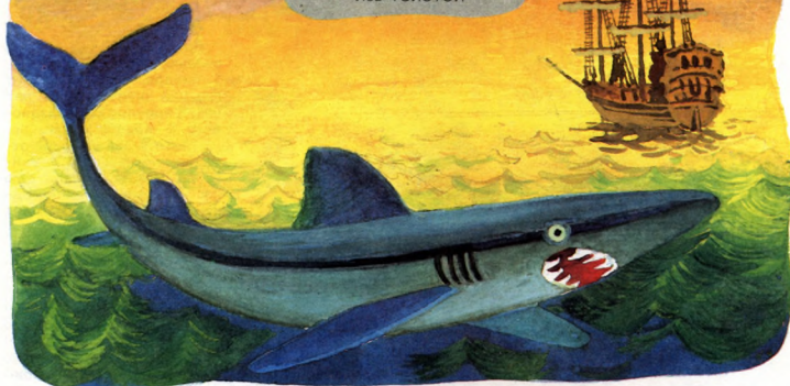
Иллюстрация В. Савиной

Наш корабль стоял на якоре у берега Африки. День был прекрасный, с моря дул свежий ветер; но к вечеру погода изменилась: стало душно и точно из топленной печки несло на нас горячим воздухом с пустыни Сахары.