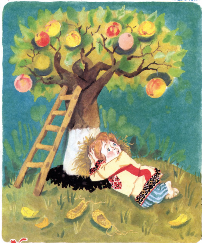
Иллюстрация А. Сивеев