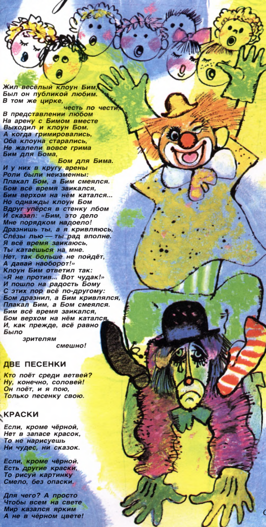
Иллюстрация В. Яковлева