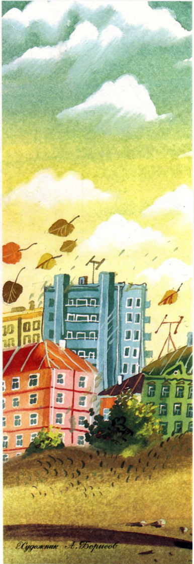
Иллюстрация А. Борисов